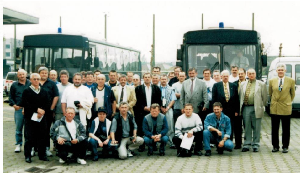
De volledige Hongaarse delegatie – De Leden werden trouwens rond gevoerd met de bussen van de Federale Politie.