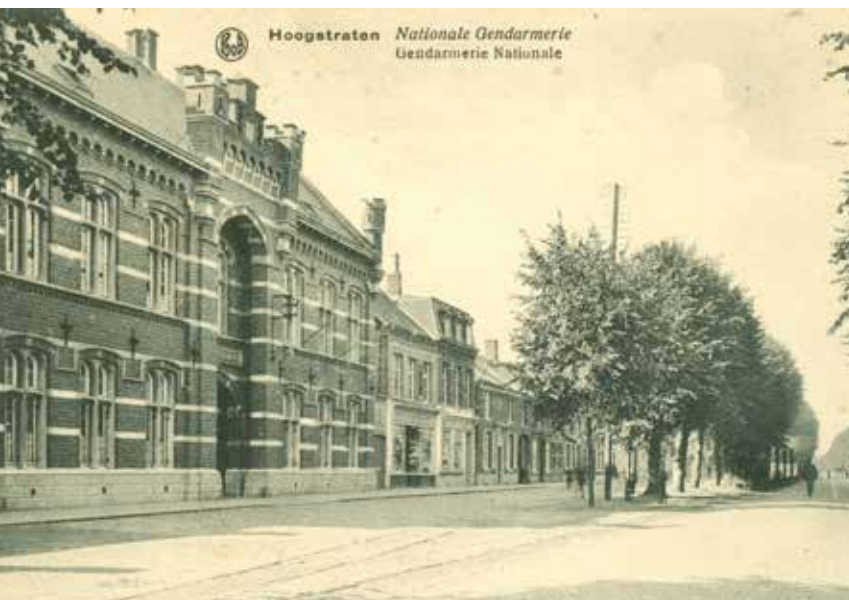
Sint Rijkswachtkazerne Hoogstraten

Ook de Rijkswachtkazerne werd zwaar beschadigd. Enkel het gebouw aan de straatkant was enigszins gaaf gebleven maar de zijvleugel en de paardenstallen waren één ruïne door bombardementen. Het was daar dat wij onze intrek namen: drie kamers, zonder water, zonder riolering. In het midden van de koer van de kazerne stonden een drietal WC-huisjes. In een zijgebouw, waarvan nog één lokaal gave muren bezat bevond zich een putwaterpomp.