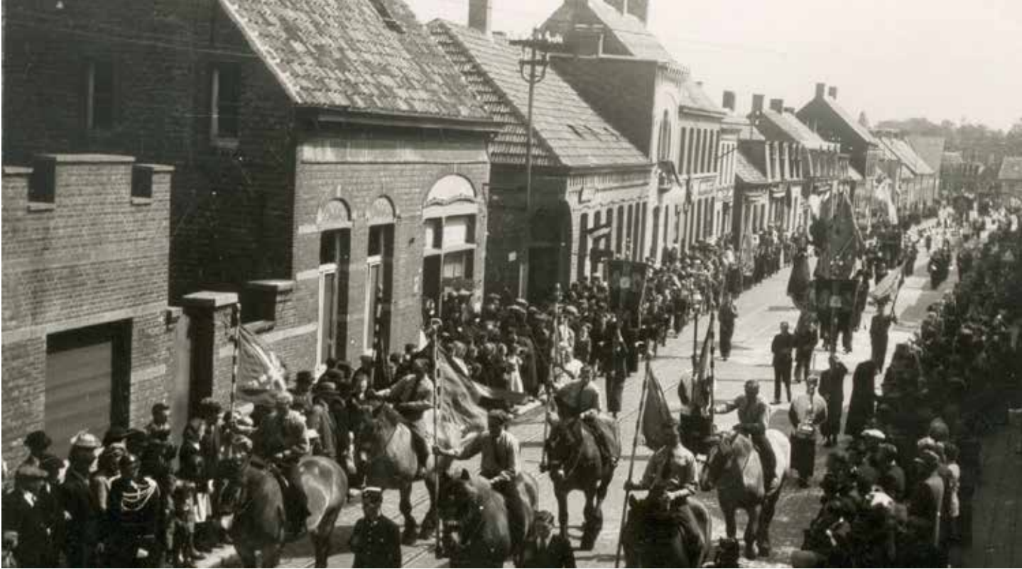
De Heilig Bloedprocessie van Hoogstraten in 1945

Toen de priester halt hield aan het laatste kapelletje vlak bij de kerk die omringd was met kermismolens en kramen en te midden van een dichte menigte gebeurde het. Terwijl de priester de monstrans ophief en de gendarmen in houding gingen staan bij het bevel "presenteer geweer" ....een oorverdovende knal verscheurde de stille ingetogenheid van het verschieten liet de priester bijna zijn monstrans vallen. Enkele vrouwen slaakten en gillette en dan werd alles doodstil. De oorzaak van de knal, plots was een van mijn collega- rijkswachters zijn geweer afgegaan, de loop van het wapen omhoog gericht de kogel de lucht in.