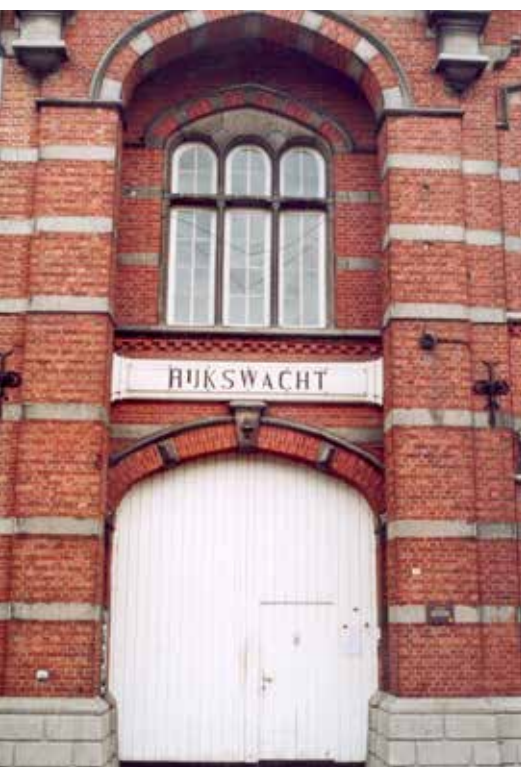
Sint Rijkswachtkazerne Hoogstraten